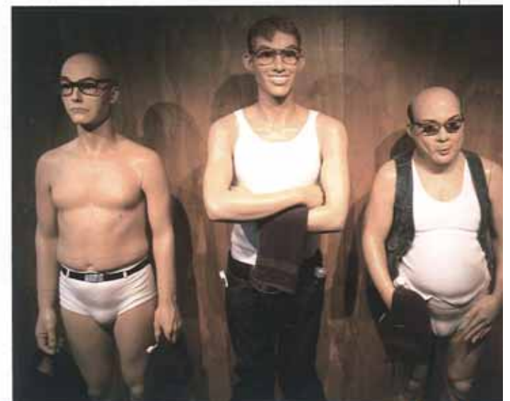
„Ugly-Collection“ von Hans Boodt Mannequins.