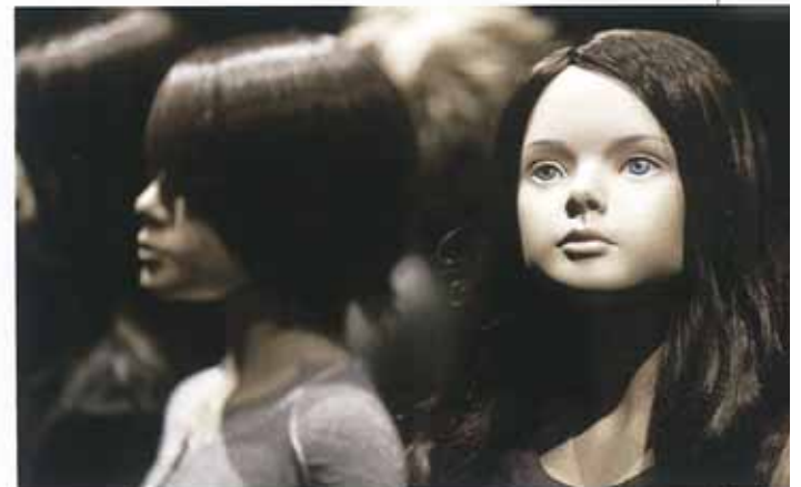
Realistische Kinderfiguren von Window-Mannequins.