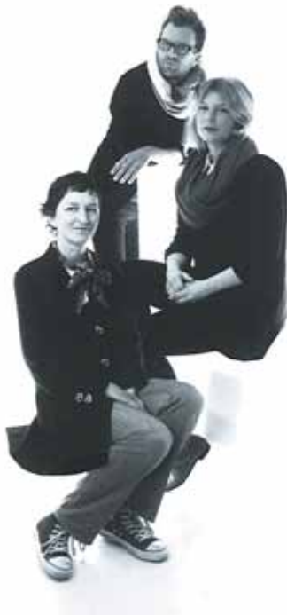
VM-Team von Liganova, Stuttgart

Die Kolumne des Departments Visual Merchandising bei LIGANOVA in Stuttgart beschäftigt sich mit den Trends der EuroShop 2011.