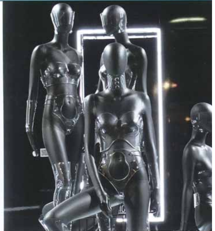
Vision Manichini auf der EuroShop.