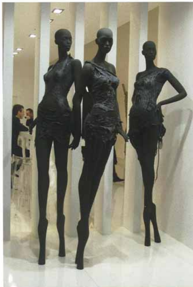
Figuren von Bonami.

Egal ob Schaufensterfigur oder gesamtes Ladenkonzept: 2011 werden unterschiedliche Schwerpunkte gesetzt. Die Devise heißt „Zurück zur Natur“ und „Schöne Neue Welt“. Und eines zeigte uns die EuroShop 2011 deutlich: besonders interessant wird es, wenn es gelingt, eine Brücke zwischen beiden Ansätzen zu schlagen.