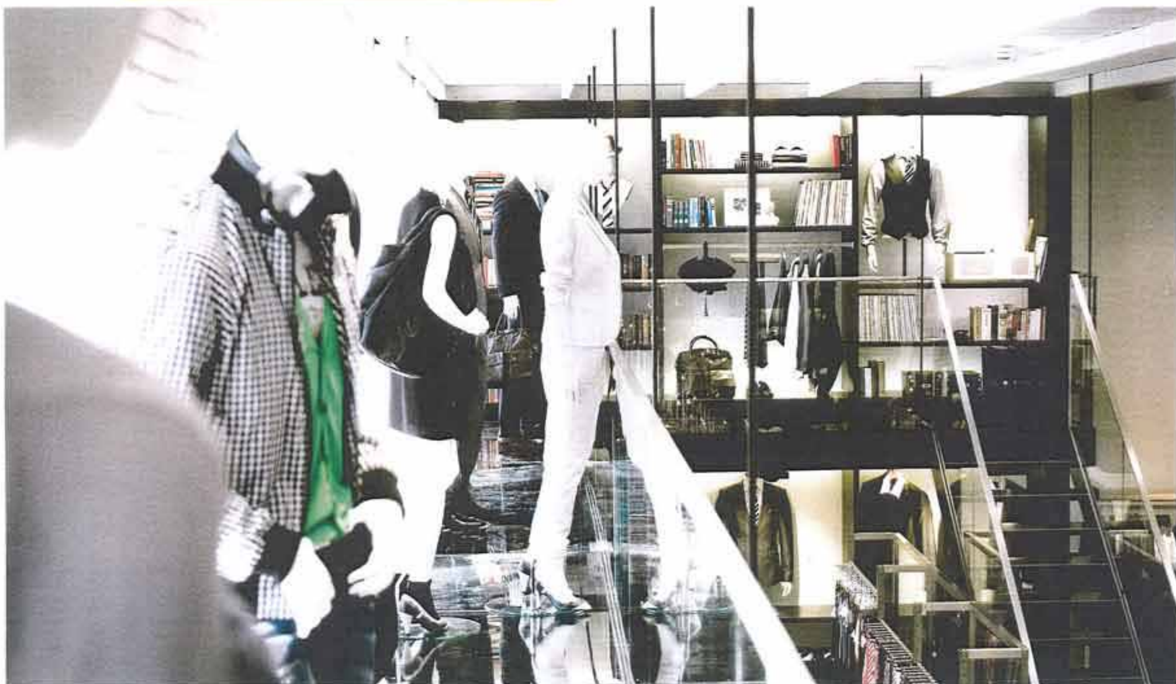
Liganova Brand Retail Company, Stuttgart. Neues WE Store-Konzept.