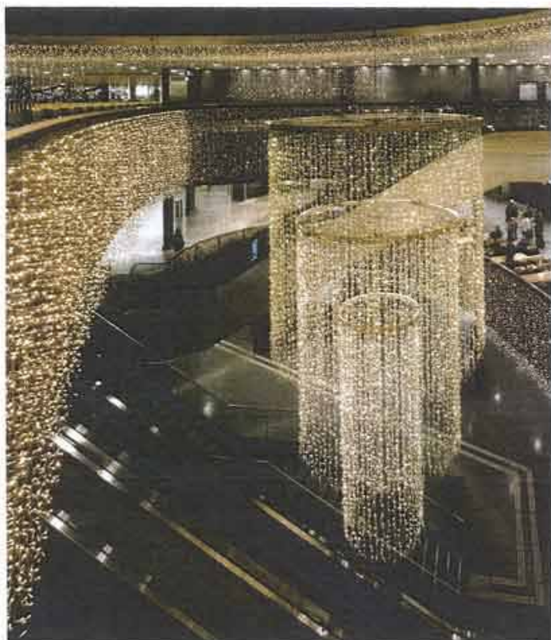
Roger Stämpfli, Aroma Production AG, Zürich.