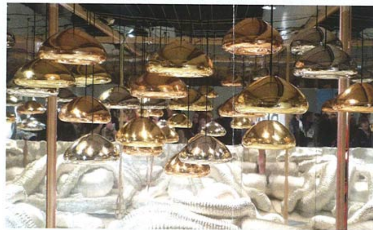
Superstudio Piu – Leuchte „Void“ von Tom Dixon.