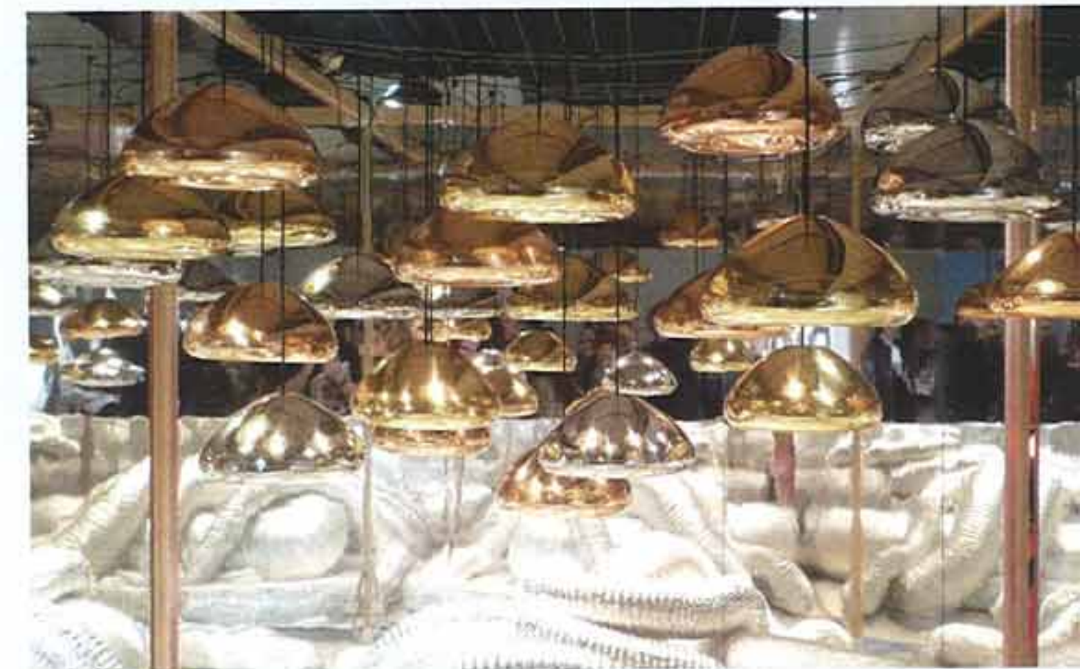
Superstudio Piu – lamp „Void“ by Tom Dixon.