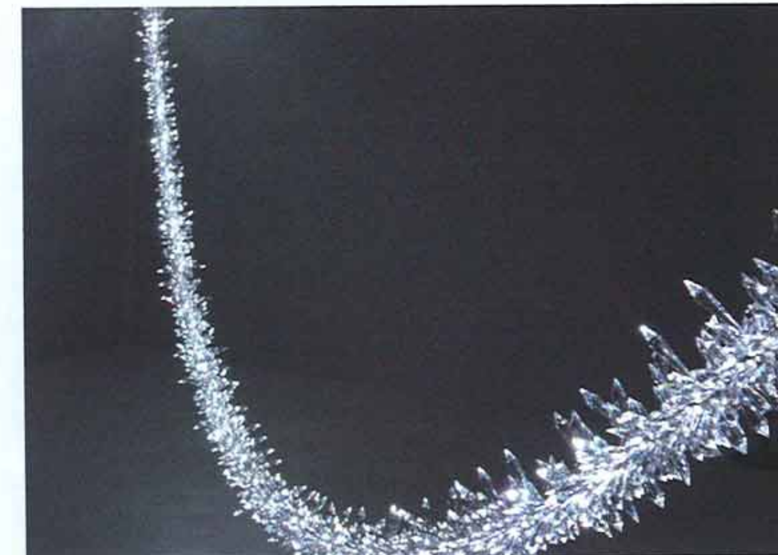
Superstudio Piu – Yves Behar's installation „Amplify“ for Swarovski.