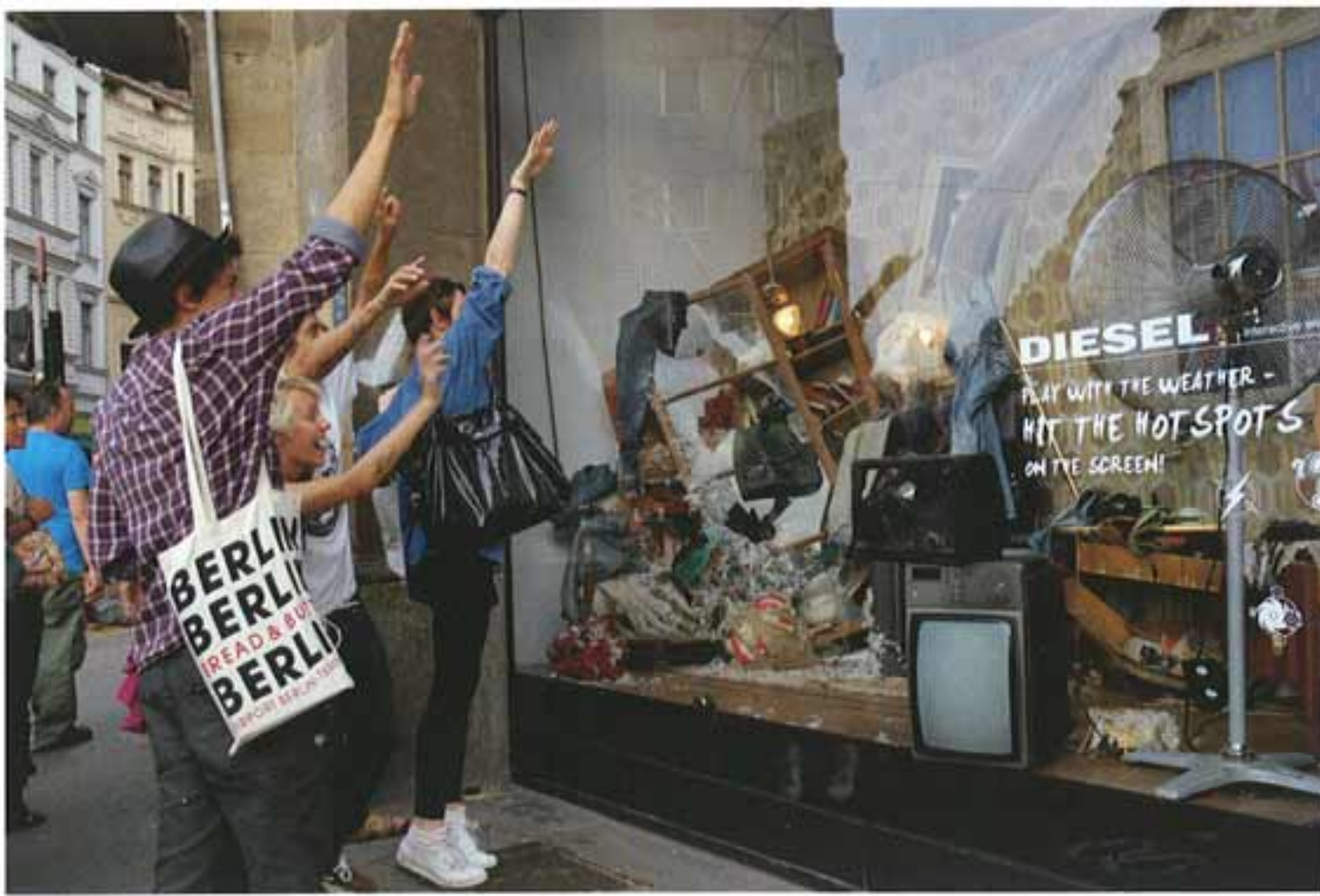
Diesel Interactieve etalage voor de Diesel herfst/winter campagne 2009. Afbeelding linkerpagina: detail van de etalage.