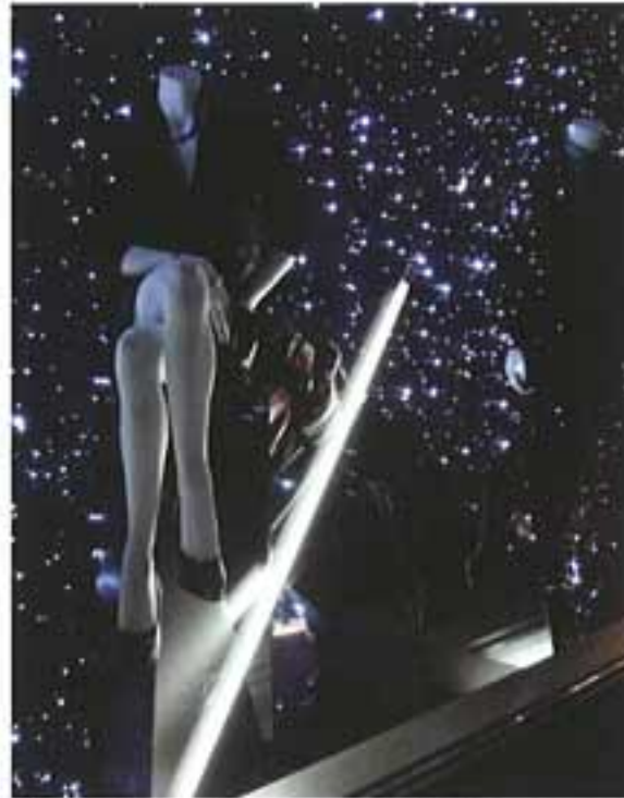
Joop! Speciale etalage voor de Joop! Kerstmis campagne 2009.