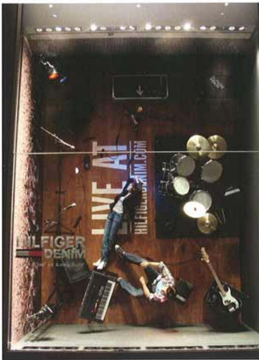
Tommy Hilfiger Speciale etalage installatie van Tommy Hilfiger in Rinascente in Milaan.