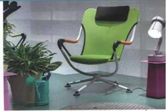
Waver – Sessel von Konstantin Grcic für Vitra