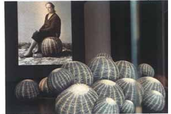
Cerruti Baleri – „Tato Tattoo“ – Stühle