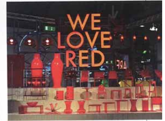
Kartell – „We love red“