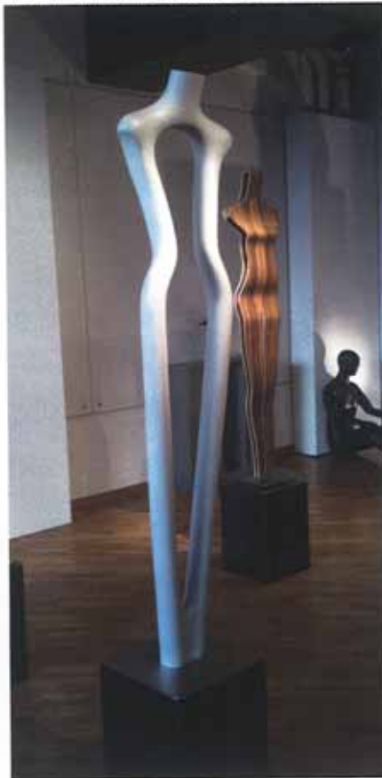
MD Studio – Mannequins aus nachwachsenden Rohstoffen

Zurück in der Zona Tortona ist es ungleich hektischer, lauter und bunter. Hier entdeckte ich die Präsentation des MD Studio, die sich zum ersten Mal präsentieren. Ihr Auftritt ist still, ihr Design klassisch. Ihre Mannequin-Kollektionen fertigen sie aus nachwachsenden Rohstoffen. Damit kommen sie nicht nur den Anforderungen der eigenen Branche entgegen, sondern